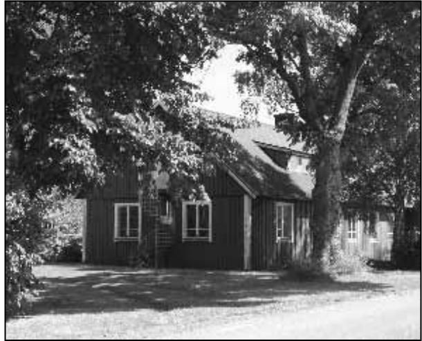
Detta är den västra delen av byggnaden som var färdig 1840

Skolan hade två avdelningar. En avdelning var för begåvade och en för mindre begåvade barn. Undervisningen på morgonen började under vinterhalvåret när det blivit ljust. Barnen fick hjälpa till med praktiska uppgifter som att bära in ved och elda i den stora kaminen.