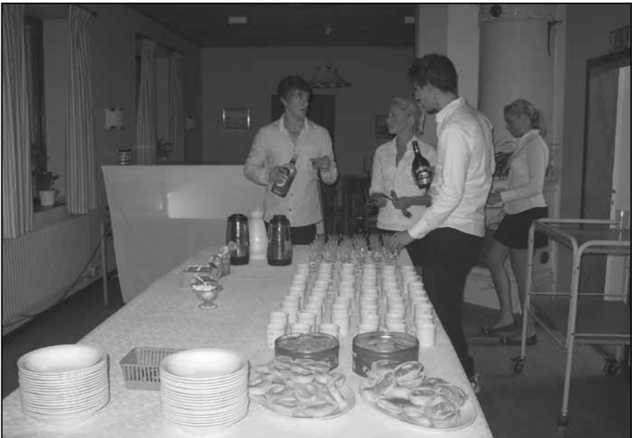
Kaffe serveras i Bygdegården – rummet var tidigare lärarebostad