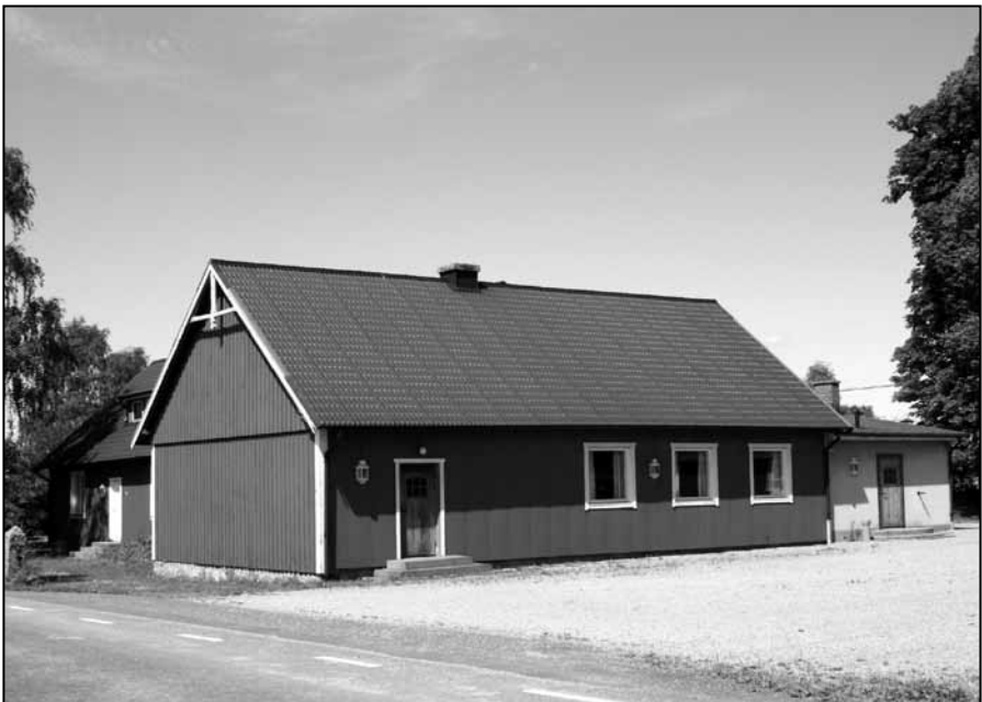
Det är den mörka byggnaden närmast som invigdes 1866.