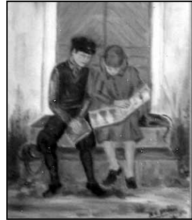
Oljemålning av YPL

i småskolorna i Håstad, och vid Karsholms fyra flyttas.