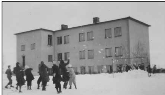
Nya skolan vintern 1948