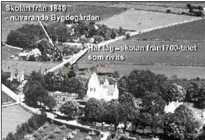
Skolan från 1700-talet, Bykrogen och Hospitalet finns inritade i detta foto

År 1840 hette Sveriges konung Karl XIV Johan. Han var 79 år och den förste konungen i ätten Bernadotte. I Kristianstad bodde 4 540 personer. I Österslöv vid Råbelövssjön en mil norr om staden stod en ny skola färdigbyggd strax intill Byahålan. Många personer i trakten tyckte att det var det ”vackraste huset” i byn. Det är den västra delen av nuvarande Bygdegården som är denna skolbyggnad och som kommer till användning även år 2010, om än på lite annorlunda sätt.